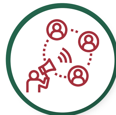
Sophie Siffert Communication, signalétique et décoration